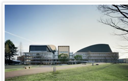
いわきアリオス 外観